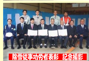
除雪従事功労者表彰 記念撮影