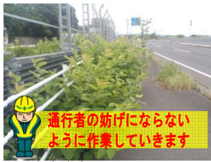
通行者の妨げにならないように作業していきます