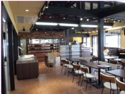
▲施設内に入るベーカリー この他にカフェテリア・レストラン もあります