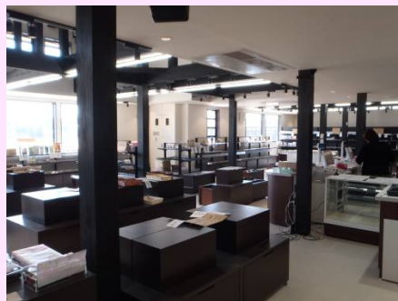
▲物販コーナーも準備が進んでいます