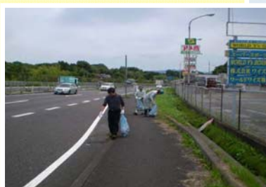
▲「クリーンアップ作戦」の様子