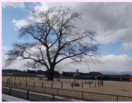
▲道の駅内には万燈桜があります