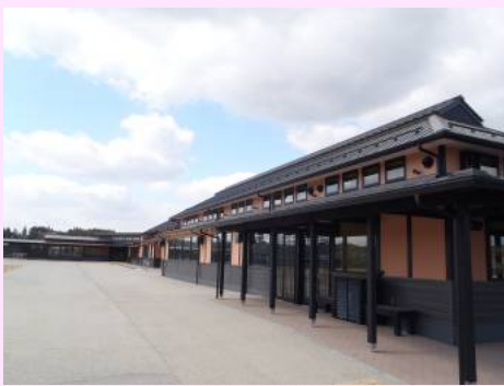
▲地域振興施設全景