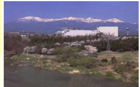
▲安達太良山と阿武隈川に囲まれた二本松工場