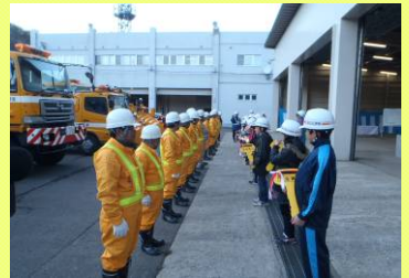
▲児童から運転手へ鍵の受け渡し