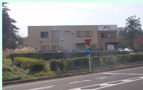
▲社屋と国道4号緑地帯