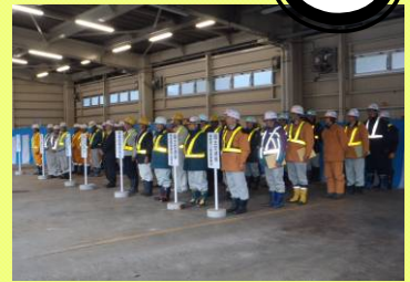
▲除雪出動式の様子