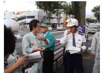
▲合同点検実施状況 ((仮)第二清水ビル前交差点)

■事故ゼロプランの詳細はこちら： http://www.thr.mlit.go.jp/fukushima/fukushima_jikozero/htdocs/index.html