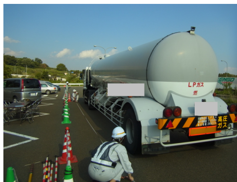
▲車両の長さを計測しています

当日は、車両の大きさや道順、通行時間などの確認を行い、約2時間の取締りで5台の特殊車両を検査して、2台について無許可の指導警告を行いました。