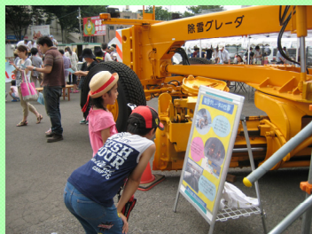
▲除雪車の説明パネルを覗き込む子供達