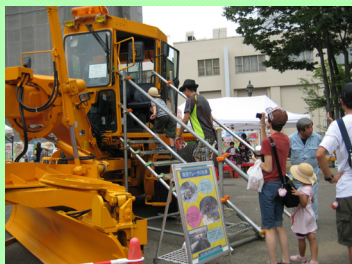
▲写真を撮るご家族

福島国道維持出張所からは 除雪グレーダ (全長約9.5m)の展示を行うとともに、運転席への試乗を実施し、多くの家族連れの皆様に乗車体験していただきました。