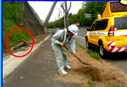
あらかじめ情報提供いただき確認しました。木があった箇所が大きくえぐられて危険！穴埋めと歩道の清掃をしています。