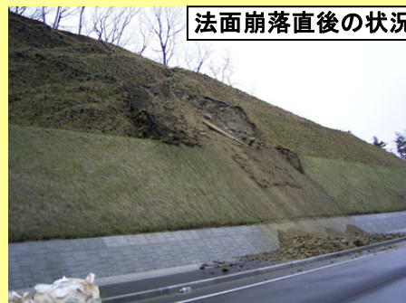
法面崩落直後の状況

平成22年4月13日(日)午前1時30分頃、大玉村大山字堂ヶ久保付近の国道4号脇の法面の一部が崩落しました。