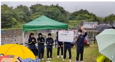
雨の中、西信中学校の皆さんが活躍していました！