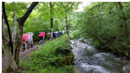
▲四季の里付近、新緑の中をウォーキング

6月11日、福島市の四季の里を発着点に、あらかわ・ふるさとの川ウォーキングが開催されました。11kmと6kmの二つのコースにわかれ、約860人の参加者が荒川周辺を歩きながら初夏の自然に触れました。あいにくの小雨模様となりましたが、深まる緑と雨音に包まれながら荒川にある国登録有形文化財「地蔵原堰堤」やあづま総合運動公園のイチヨウ並木などを巡りました。コースの所々で西信中学校の生徒による荒川の治水の特徴や周辺の名所紹介などがあり、参加者の皆さんは飽きることなく心地よい汗をかかれています。