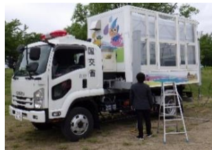
▲降雨体験装置雨二ティ一号

5月13日、荒川桜づつみ河川公園前荒川河川敷で4年ぶりに荒川フェスティバルが開催されました。福島河川国道事務所は「防災・減災コーナー」に降雨体験装置と土石流模型実験装置を出展しました。降雨体験装置では過去に降った大雨を体験してもらいました。土石流模型実験装置では、大雨が降って土石流が発生したときに砂防堰堤の有無によってどれだけ被害が違うかについて、地域の方に見てもらいました。