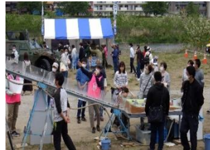
▲たくさんの方が見学してくださいました