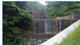
東鴉川第6砂防堰堤 R5.7月撮影