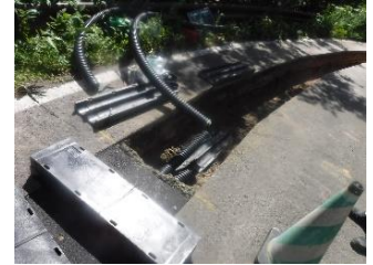
▲②光ケーブルを入れるための管を敷設します。