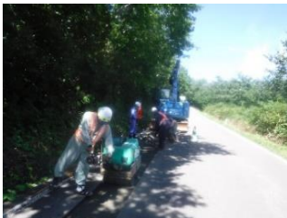
▲③管を敷設したら道路を元の状態に埋戻します。