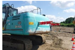
▲大型重機周りの安全は大丈夫かチェック！