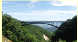
つばくろ谷 R4.8月撮影