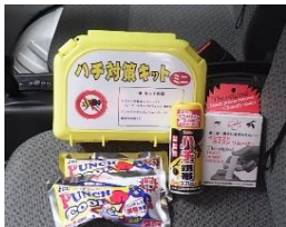
▲ハチ対策応急セット ハチ対策スプレー、 ポイズンリムーバーなど