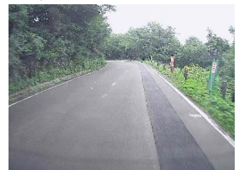
▲④道路を舗装して元の状態にして完了です。