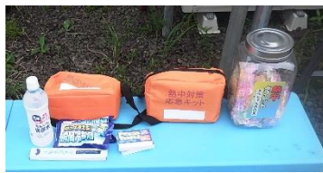
▲熱中症対策応急セット 塩分タブレット、飲み物、 クールシートなど