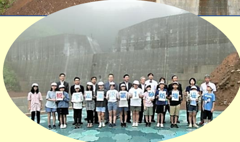
▲砂防堰堤の前で写真撮影