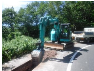
▲①道路の一部分を掘削します。