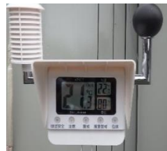
▲▶WBGT熱中症計を使用して作業員の方へ周知を行っています