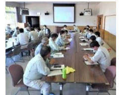
▲広い会場で、換気を行いながら検討会