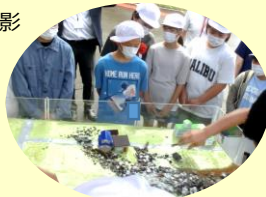
▲土石流模型実験の体験