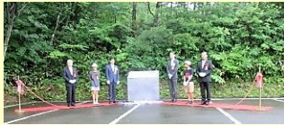
▲代表者で説明板の除幕