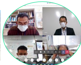
密にならないように 時間差で点検