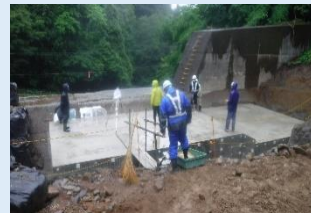
【東鴉川第6砂防堰堤】 流木止めの基礎を 造っています R4.5.31