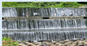
地蔵原えん堤 R4.6月撮影