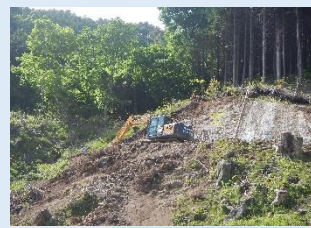
【塩の川第8砂防堰堤】 工事用道路の掘削を 行っています R4.5.30