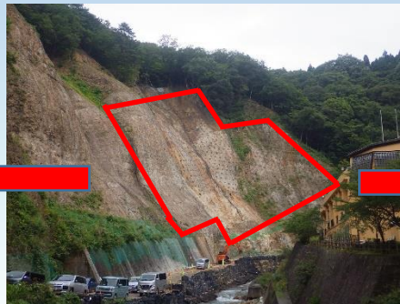
▲赤枠が防護網設置箇所