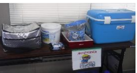
▲飲み物、塩飴、クールシートを常備