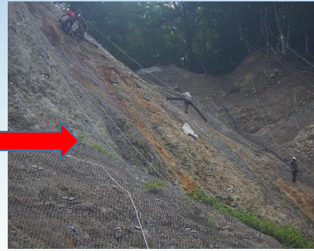
▲防護網を設置しています