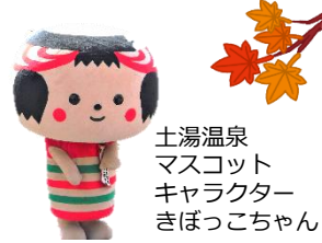
土湯温泉 マスコット キャラクター きぼっこちゃん

7月31日、8月1日の二日間にわたり、土湯温泉でこけし祭りが行われました。福島河川国道事務所では、土石流模型実験やパネル展示を行いました。