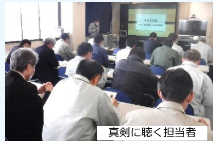
真剣に聴く担当者