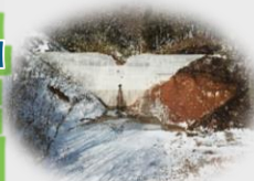
下高湯沢第1砂防堰堤 R1.12月撮影