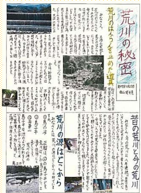
学んだことなどを新聞にしっかりまとめてくれました。