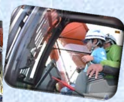
真剣に重機を動かしていました