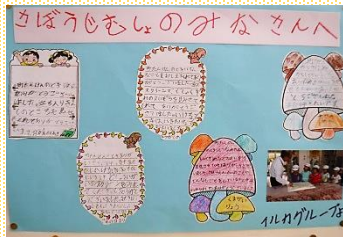
町たんけんに来てくれたみなさんから素敵なお礼状をいただきました。