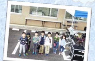
★ドローンのカメラでパチリ★