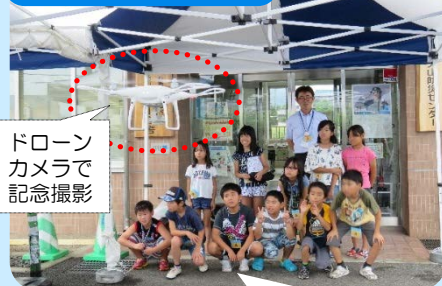
ドローンカメラで記念撮影

人が歩いたら1時間かかる山の中でも、ドローンを飛ばせば数分で現地の状況が確認できます。 砂防施設の点検で活躍しています。