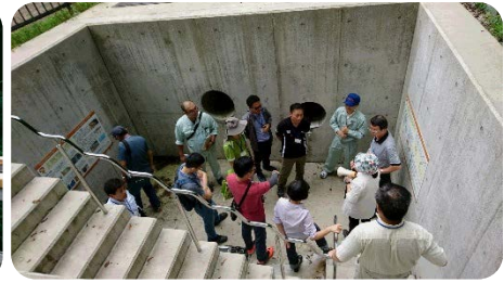
【東鴉川「小水力発電」】