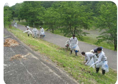
昨年の「荒川クリーンアップ大作戦」の様子

http://www.mlit.go.jp/river/toukei_chousa/kankyo/kankyou/suisitu/h28_suisitu.html