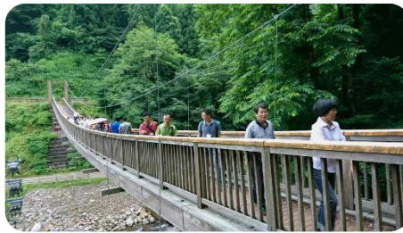
【東鴉川「滝のつり橋」】