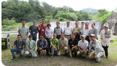
【地蔵原堰堤での集合写真】

【日・台砂防共同研究会とは】 (一社) 全国治水砂防協会、 (一社) 国際砂防協会主催のもと、土砂災害を取り巻く環境に共通した課題を持つ日台両国が、シンポジウムや現地視察等を通じて土砂災害防止に関する砂防技術の向上を図るもので、交流の歴史は28年を数える。