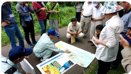
【平成10年破堤箇所「日ノ倉橋付近」】