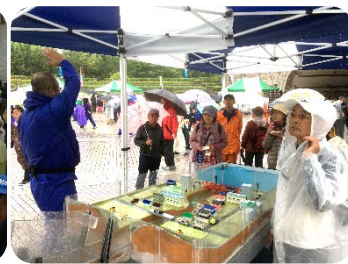
土石流模型実験の様子