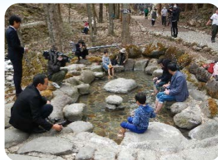
観光協会近くにある足湯