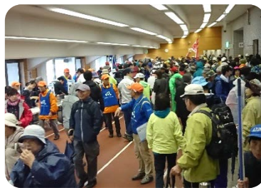
開会式に集まった参加者

当出張所では、「土石流模型実験」を行いました。例年にはない雨の降る中での実験ではありましたが、より臨場感のある内容になり、土石流の恐さや砂防堰堤の大切さを感じていただけたかと思います。