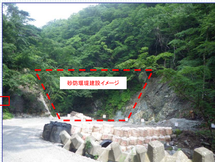
砂防堰堤建設イメージ

②松川(大笹生地区)では、「松川遊砂地」の整備工事を進めており、現在は、玉石を護岸(ごがん)に積んでコンクリートで固定する玉石積み護岸の整備を実施しております。玉石は、現地の河原のものを使用しています。