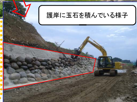
護岸に玉石を積んでいる様子