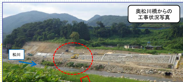
奥松川橋からの 工事状況写真