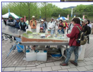
(写真上↑) パネル展示の様子 (写真左←) 土石流模型実験の様子。皆さん真剣に見てくれました。