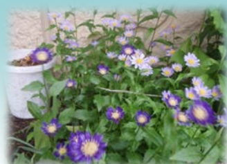
↑出張所に咲いた「都忘れ」