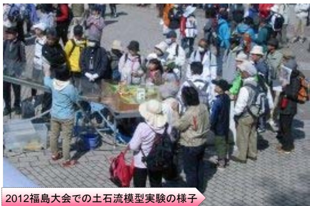
2012福島大会での土石流模型実験の様子