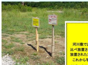
←注意看板を設置しました

河川敷は、みんなが利用する空間です。気持ちよく利用していただくためにも、他人に迷惑となる行為はしないよう、また、いつも美しい河川であるよう、ゴミは持ち帰るようにお願いします。