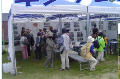
↑パネル展も大盛況!

また、地蔵原堰堤などの歴史的文化遺産のあるポイントでは西信中学校の生徒がボランティア参加でパネルを使用した説明を行い、参加者の皆さんが楽しく学びながらウォーキングをしていました。