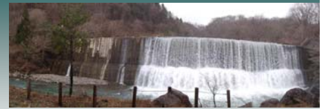
さぼうえんてい 荒川第5砂防堰堤全景