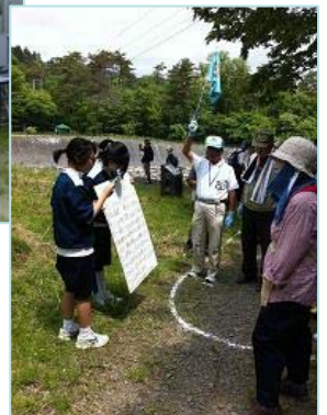
地蔵原堰堤にて。西信中の生徒さんが一生懸命説明しています。