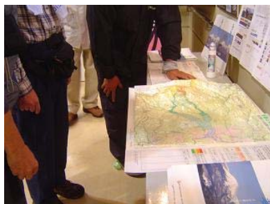
↑立体地図では福島市の地形の特性がよくわかります。

←こちらのパネルは吾妻山山系砂防出張所松川庁舎ロビーでもご覧いただけます。(開庁日の8:30~17:15)