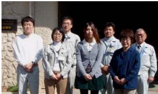
出張所長から一言

24年度の砂防出張所のメンバーです。 日本百名山の一つである吾妻山周辺は、優れた景勝地である一方で火山活動に伴う泥流が多く堆積していて、浸食や崩落を受けやすい地域でもあります。土砂災害の防止を行い地域の皆様の暮らしを守るため、メンバーが一つとなって砂防事業を進めて参ります。どうぞよろしくお願いします。