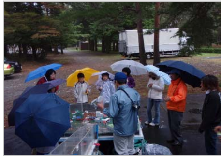
土石流模型実験では土石流の力や砂防堰堤の効果にビックリ！！