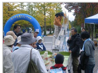
多くの参加者に体験していただきました。