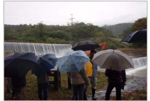
地藏原堰堤を前に川や砂防堰堤について勉強中です。