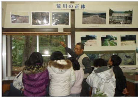
荒川資料室には多くの写真や資料があります。

荒川資料室で荒川づくり協議会の方から荒川についての説明を受けた後、火山噴火実験(炭酸飲料水を使って簡単にできるものです)と4年生は土石流模型実験を見学しました。両日とも肌寒い日でしたが、間近に見る霞堤や地藏原堰堤などを荒川の散策と併せて楽しみながら学んだようです。