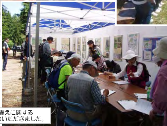
災害の経験や備えに関する アンケートにご協力いただきました。