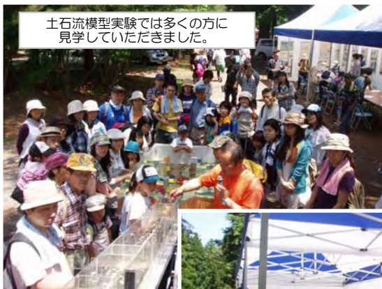
土石流模型実験では多くの方に 見学していただきました。

吾妻山山系砂防出張所では荒川資料室にて土石流模型実験やパネル展示を行い、参加者の皆さんに土石流の恐ろしさを体験していただきました。また地蔵原堰堤などの歴史的文化遺産のあるポイントでは西信中学校の生徒がボランティア参加でパネルを使用した説明を行い、参加者の皆さんが楽しく学びながらウォーキングをしていました。