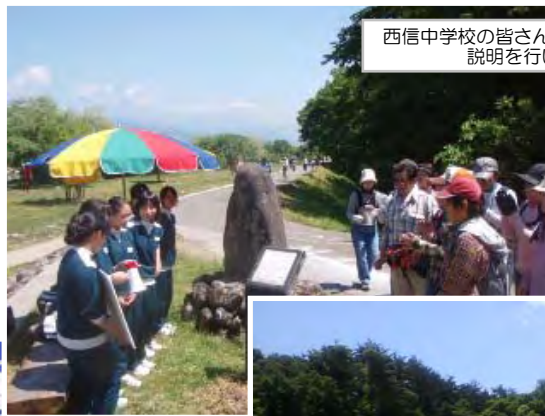
西信中学校の皆さんが歴史的文化遺産の 説明を行いました。