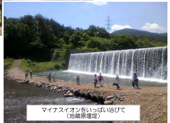
マイナスイオンをいっぱい浴びて (地蔵原堰堤)