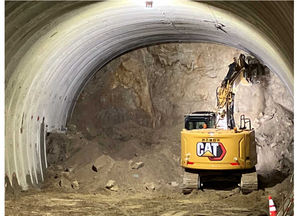
終点側 (トンネル掘削)