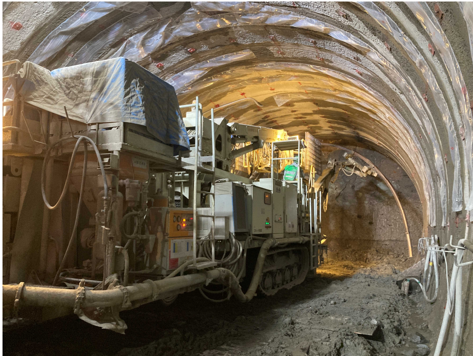
起点側 (トンネル掘削)