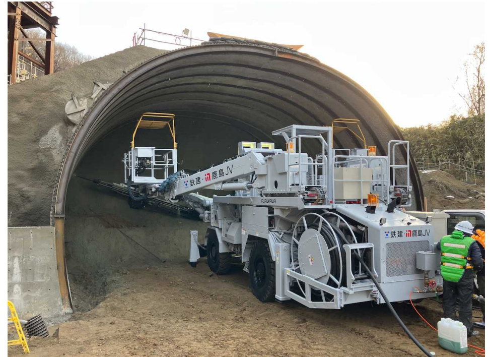
終点側 (トンネル掘削)