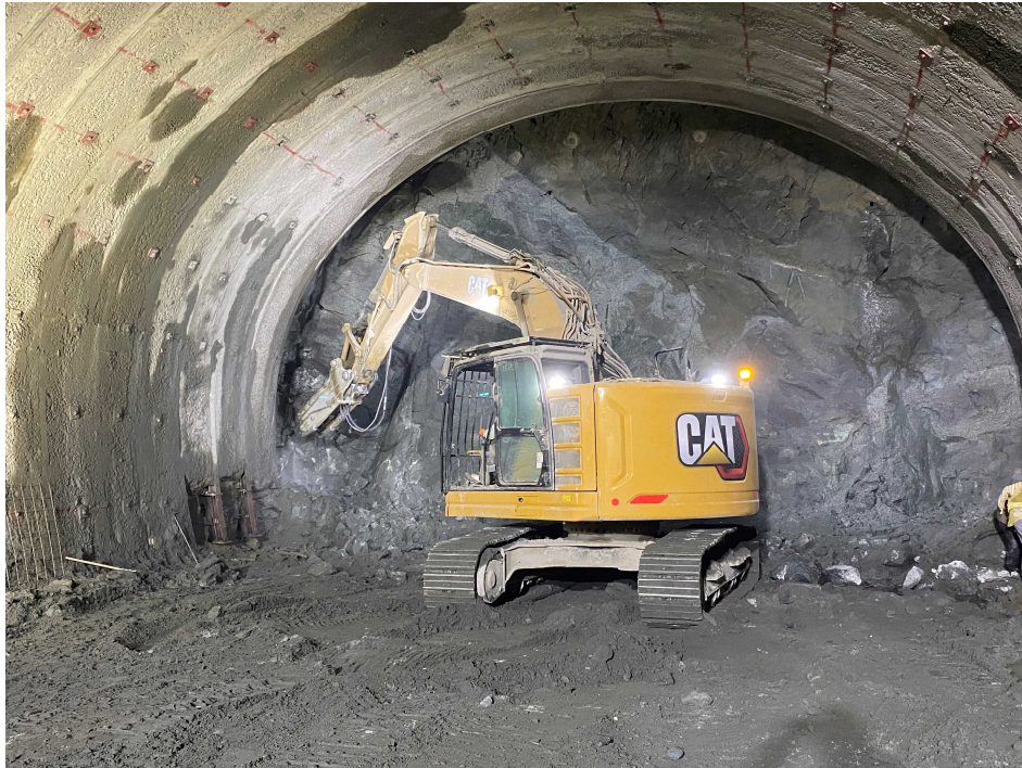
起点側 (トンネル掘削)