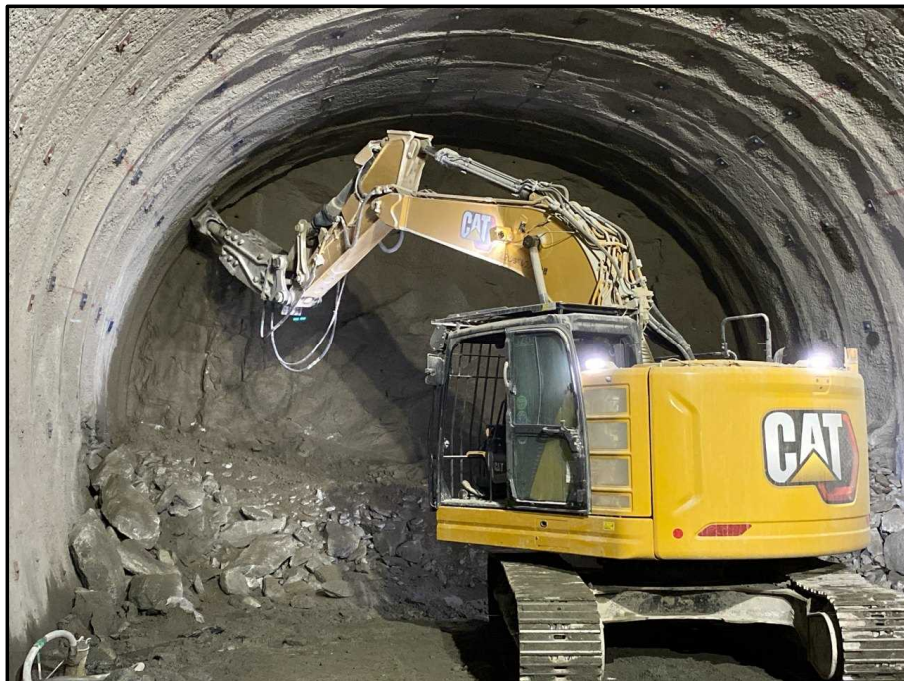
起点側 (トンネル掘削)

<現在の進捗> トンネル掘削前の準備作業中 覆工コンクリート 0m (進捗率 0.0%)