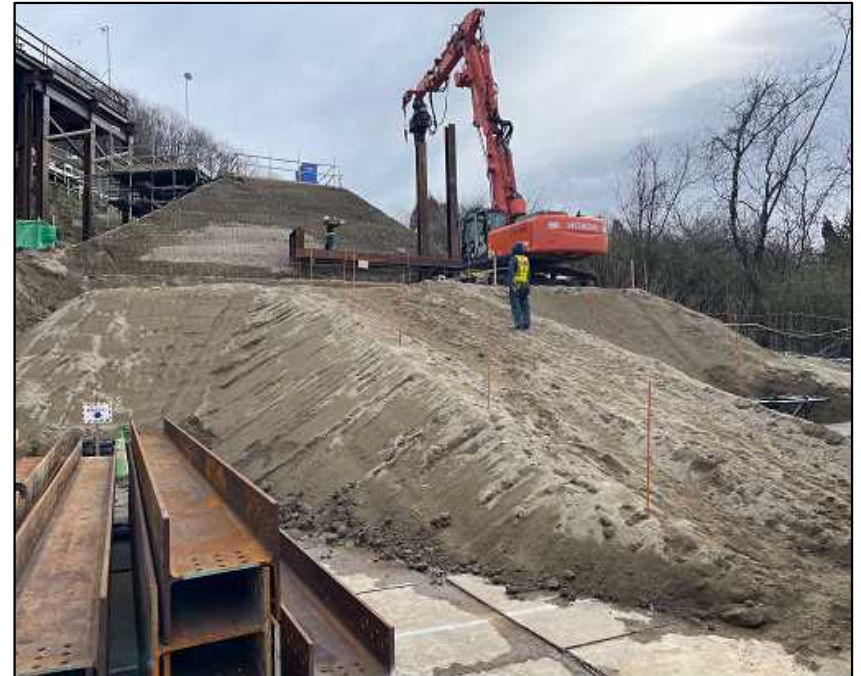
終点側 (トンネル前面土留壁の親杭打設)