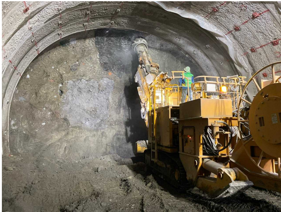
起点側 (トンネル掘削)

<現在の進捗> トンネル掘削前の準備作業中 覆工コンクリート 0m (進捗率 0.0%)