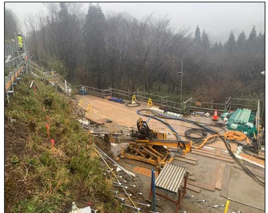
終点側 (薬液注入工)