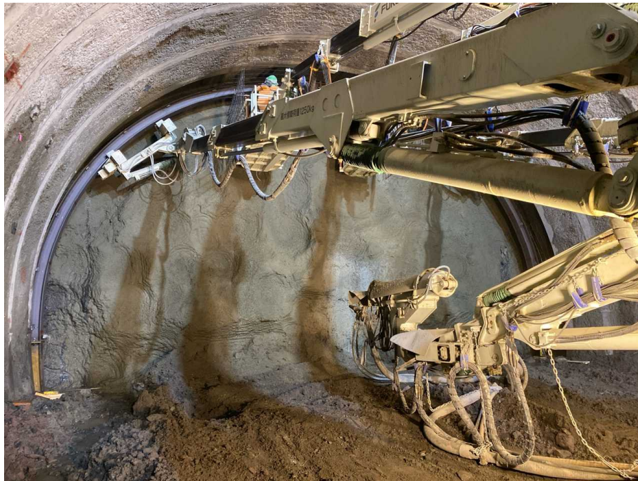
起点側 (支保工建て込み)