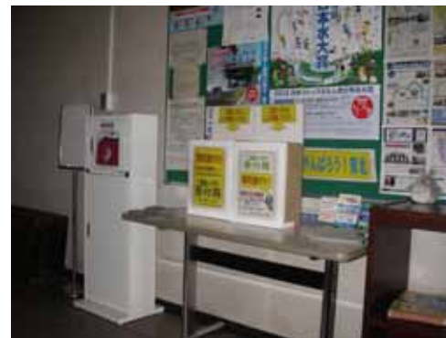
仙台河川国道事務所