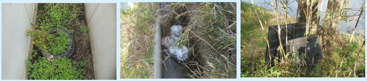
タイヤ 生活ゴミ 家電