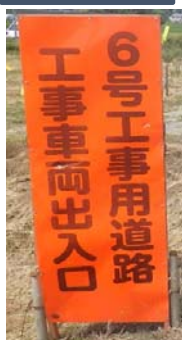
6号工事用道路 正面