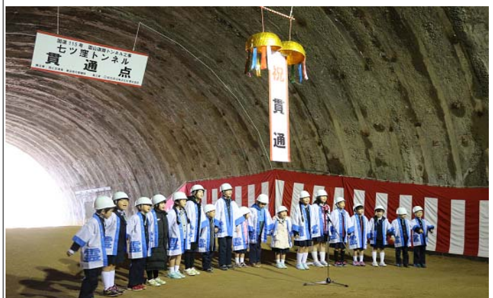
石田小学校児童による歌のプレゼント