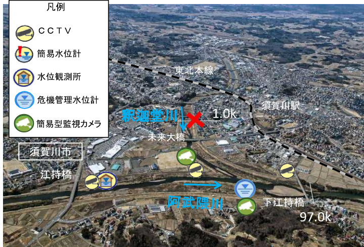
○危険箇所付近の斜め写真(1.0k付近)