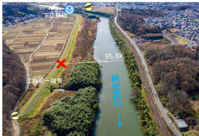
○危険箇所付近の斜め写真(95.8k付近)