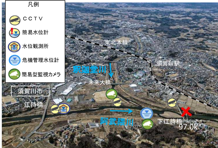
○危険箇所付近の斜め写真(97.0k付近)