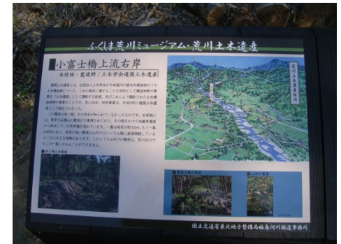
有形文化財・選奨土木遺産の紹介看板