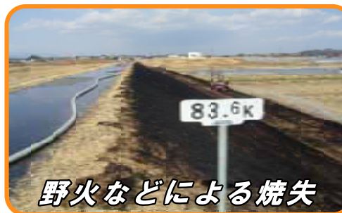
野火などによる焼失

お近くの堤防等を利用する際、こうした異常・変状を発見した場合には、お近くの事務所・出張所までご連絡ください。