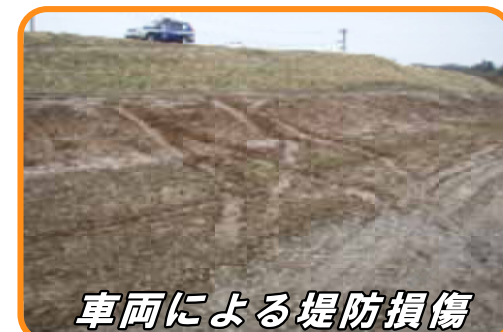
車両による堤防損傷