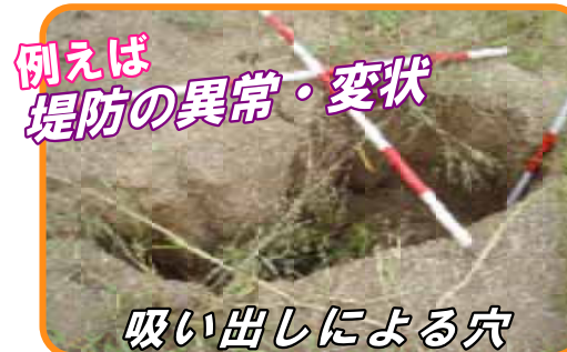
吸い出しによる穴