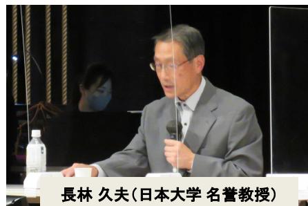
長林 久夫(日本大学 名誉教授)