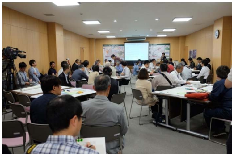
写真. 会場の様子（開会時）