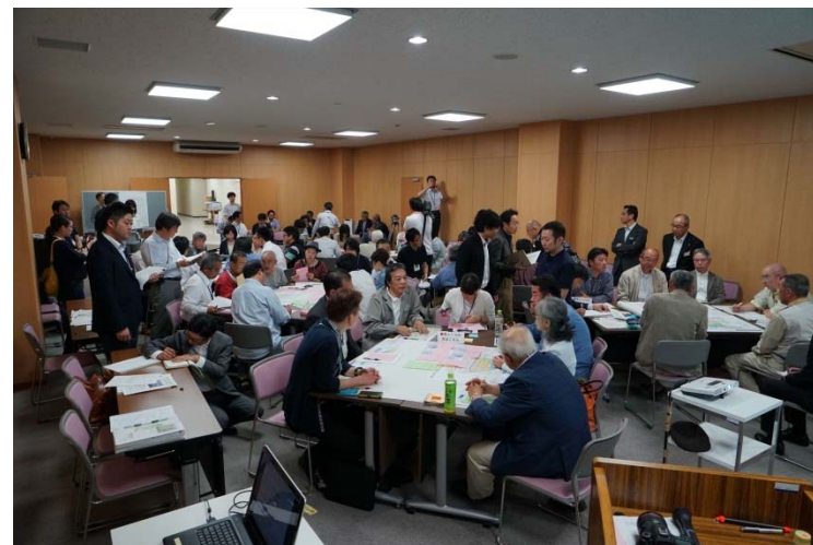
写真. 会場の様子（グループ討議中）