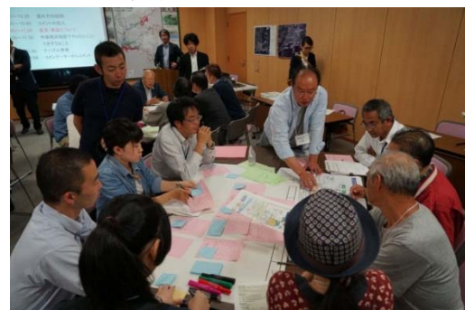
写真. グループ討議の様子