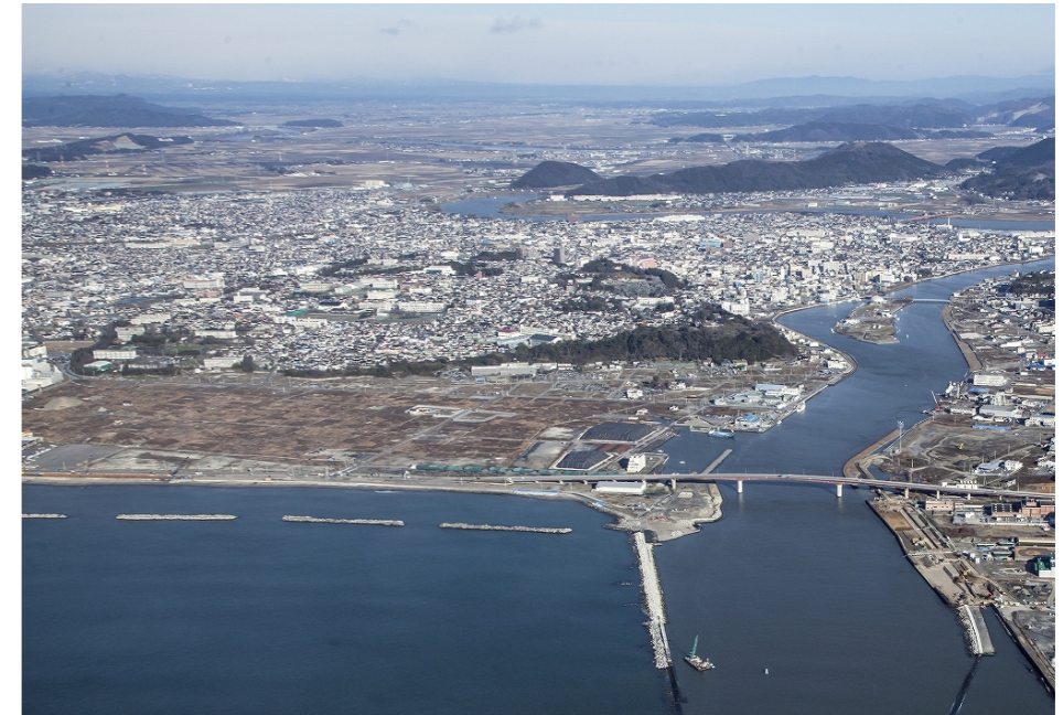
復興祈念公園計画地（平成 26 年 12 月 6 日撮影）