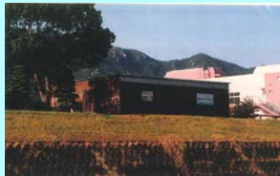
市民団体による活動拠点の整備事例（佐波川）

※ 河川管理者から河川管理施設の維持、除草等の委託を受けることも可能となります。委託先については、公募等の適正な手続きを経て選定を行う予定です。