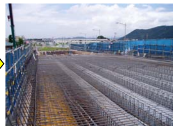
鉄筋組立 型枠組立完了後鉄筋を組立 ています。