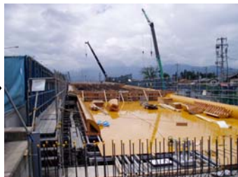
主桁の型枠 組立状況です。