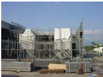
下部工(橋脚) 橋脚の間に主桁の支保工を組立ています。