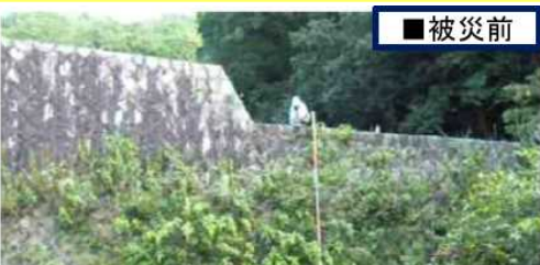
古い石積みの 砂防えん堤

昔作られた砂防えん堤はこわれてしまうこともあるけど、こわれたところは直したり、土石流にたえられるように丈夫にしているよ。