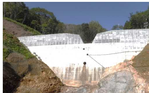
建設中の下高湯沢第1砂防えん堤

土砂をためて川のかたむきをゆるやかにする働きや、土石流や流木をしっかりと受け止め、一度に大量の土砂が町に流れ出るのを防ぎます。