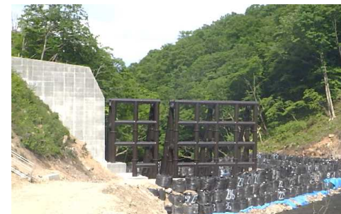
建設中の塩の川第7砂防えん堤

ふだんは、土砂を流しますが土石流として流れてきた大きな石や流木はここでとらえます。川の流れをせき止めないので水にすむ生き物に配りよされています。