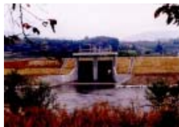
小倉川樋門工事 施工：水谷工業

須賀川地区で、小倉川樋門工事、郡山地区で水門町地区工事が完成しました。これからも、ぞくぞく工事が完成していきます。