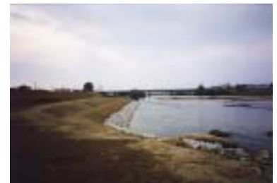
水門町地区工事 施工：むさし建設工業