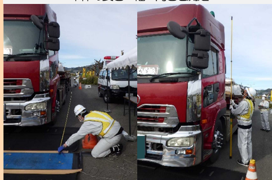
車体の長さ・幅・高さを測定

違法に重量を超過した車両は、道路や橋などの構造物に多大なダメージをあたえます。また、高さや幅を超過している車両が橋梁等に衝突する重大事故も発生しています。そのため、国土交通省では違法通行している大型車両の指導・取締りを行い、適正な道路利用を促進し、良好な道路環境の維持に努めています。