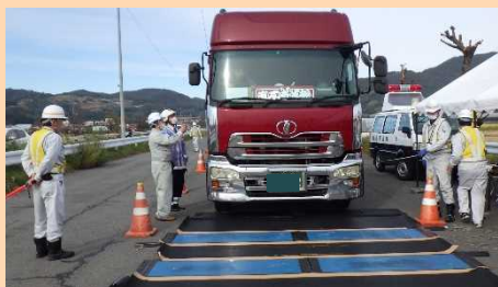
マットスケールで重量を測定