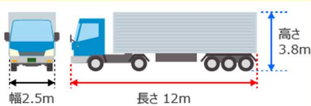
【車両の幅、長さ、高さ】