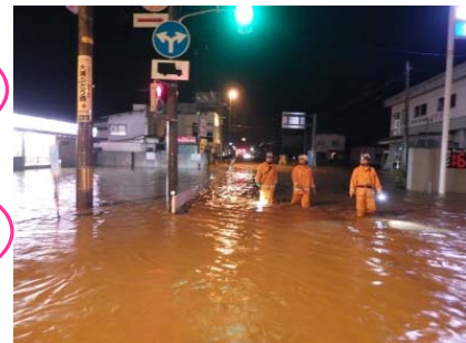
▲H26.7月豪雨 吉野川の洪水被害によりR113 南陽市赤湯地内の道路が冠水