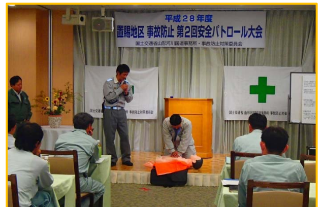
▲西置賜行政組合消防本部による心肺蘇生法の実習を交えた救急講習