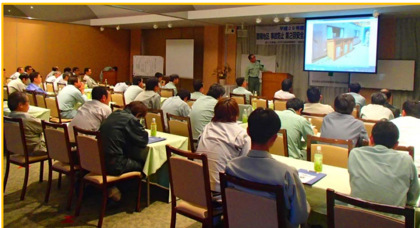
▲工事現場を点検した写真を見ながら検討会を実施

今回のパトロール現場のみならず、すべての工事現場において安全対策に努め、引き続き安全第一で工事を進めてまいります。ご協力、よろしくお願いいたします。