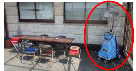
▲作業員休憩所にミストファンの設置