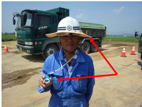
▲熱中症予防でヘルメットに日差し対策、暑さ指数計器を身に付けている