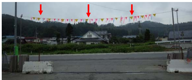
▲出入口に架空線対策のための高さ制限ゲートの設置

このほかに、 ・全体的に整理整頓されていて良い ・出水時の避難基準や場所が明示されている などの工夫が見られました。