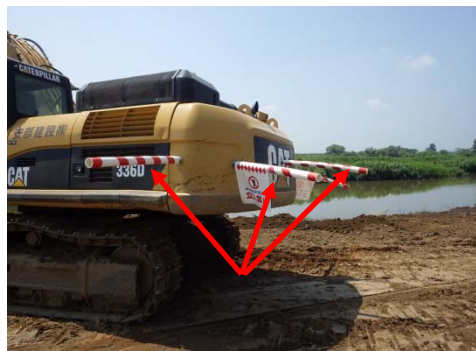
▲バックホウ後方に作業半径立入禁止の視覚的明示バーを取り付けている