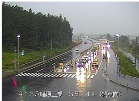
R13八幡原工業 3B.4k (終点向)