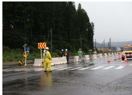
国道13号 米沢市万世町桑山 八幡原交差点