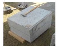
▲ひび割れコンクリート