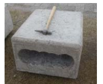
▲穴あきコンクリート