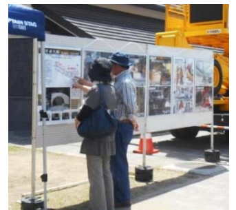
▲東北中央自動車道と国道除雪のパネル展示