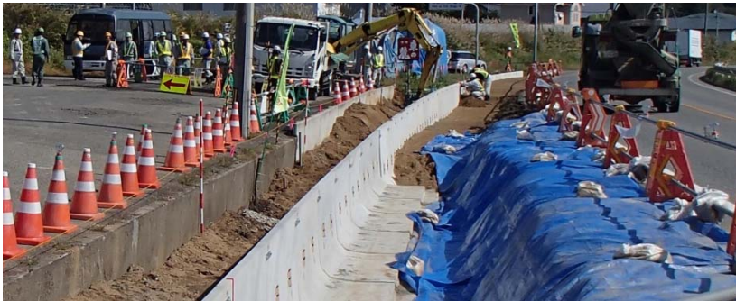
～歩道整備工事の現場点検～

置賜地区では、10月9日（木）第2回安全パトロールを実施しました。発注者及び受注者あわせて58名が参加し、工事現場の点検、「安全の基本」に関する講話、より安全に工事を進めるため検討会を行いました。