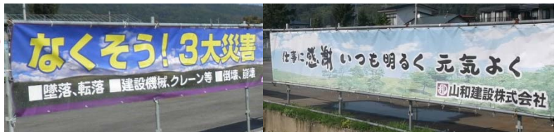
▲工事PR横断幕が良い