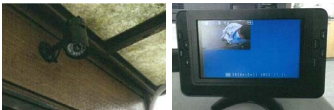
▲24時間防犯カメラが作動し、モニターで確認可能