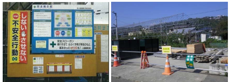
▲掲示板が見やすい