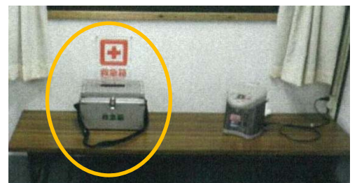
▲休憩所に救急箱を常備した