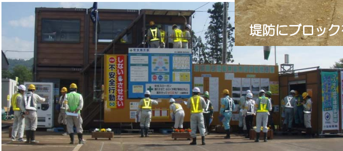
～現場事務所の点検～