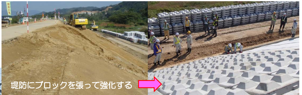
堤防にブロックを張って強化する